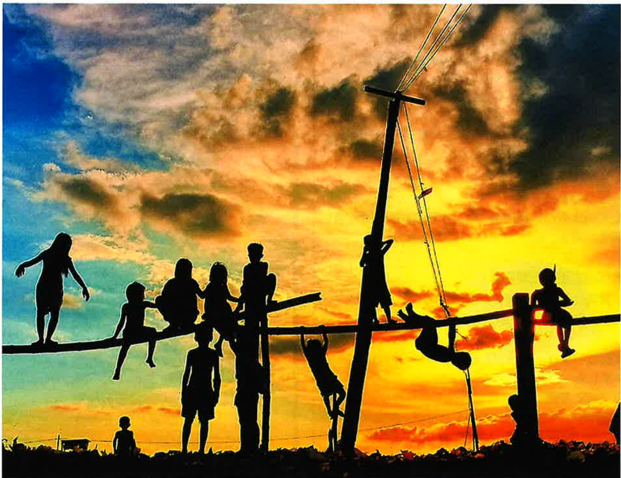
最優秀賞「マニラの夕日」